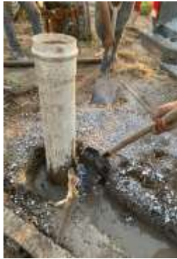
Figura 10.- colocación de filtro de grava

Cuando el pozo es terminado, es colocada la tubería de PVC para evitar derrumbes y el filtro de grava se coloca por gravedad en el espacio anular entre la tubería de ademe y las paredes del agujero (figura 10). Para pozos perforados con circulación de lodo, se introducirá la tubería de perforación franca hasta el fondo del pozo para circular agua exclusivamente, extrayéndola de tramo en tramo, hasta que por el pozo salga agua limpia (figura 11).