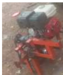
Figura 3.- Adaptación del motor con una transmisión manual de 2 velocidades