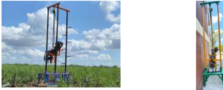
Figura 7.- Equipo de perforación para elaboración de pozos