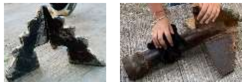
Figura 6.- Elaboración de barrena con insertos de tungsteno soldados