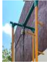
Figura 4.- Corona soporte de estructura tubular