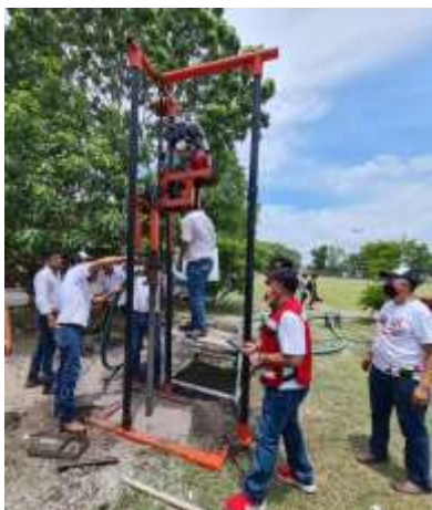
Figura 8.- Pruebas de operación de equipo

El equipo fue puesto a prueba logrando una perforación estable en un terreno con una profundidad alcanzada de 18 m de profundidad (figura 8). El equipo realizó una perforación en un terreno como parte demostrativa en un terreno de siembra de caña de azúcar (figura 9).