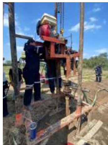
Figura 9.- perforación de un pozo de agua