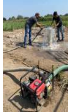
Figura 11.- lavado de pozo