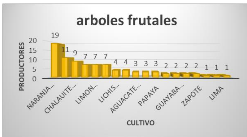
Figura 3. Categoría de cultivos regionales

En las localidades de estudio son muy pocos los agricultores que se dedican a la siembra de árboles frutales, solo 16 productores tienen árboles de naranja ( citrus x sinensis ) y de esos productores solo 6 tienen naranjales de media y una hectárea. (figura 3)