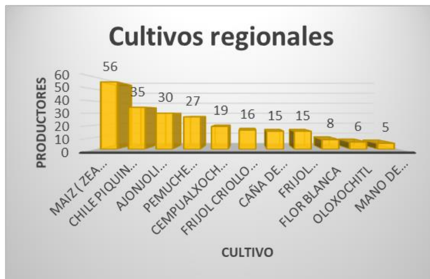
Figura 2. Categoría de cultivos regionales

30 productores a la siembra del ajonjolí ( sesamum indicum.l ) y otros productos menormente sembrados. (figura 2)